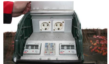
Fig 9 - Mode 2 Schuko -varmgang i eksisterende kontakt ved 16A

Dette innebærer at kursen ved bruksendring må oppgraderes til gjeldende regelverk, dvs. jordfeilbryter type B samt maks 10 A sikring for vanlig kontakt (strømbegrensingen gjelder ikke for blå / rød industri / CEE 309 kontakt). Det er også viktig å få sjekket om anlegget tåler den aktuelle belastningen over tid. Ta derfor kontakt med en elvirksomhet for å sjekke tilstanden på anlegget og få råd om nødvendige tiltak.