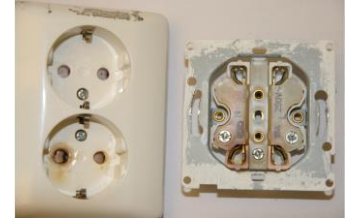
Fig 5 – Skade / varmgang kontakt ved manglende avlastning