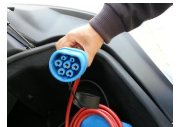
Fig 8 – Type 2 kontakt for Mode 3

DSB anbefaler derfor at det etableres en " på vegg ladepunkter " (= Mode 3) med såkalt type 2 kontakt med fremtidig mulighet for lastbalansering og betalingsløsning. Mode 3 har høy sikkerhet og gir stor fleksibilitet. (Bildet over viser Type 2 kontakt – ladepunktet er Mode 3 plassert på bakke – se ellers veileder for mer informasjon).