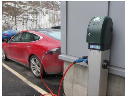
Fig 7 - Mode 3 ladepunkt på søyle