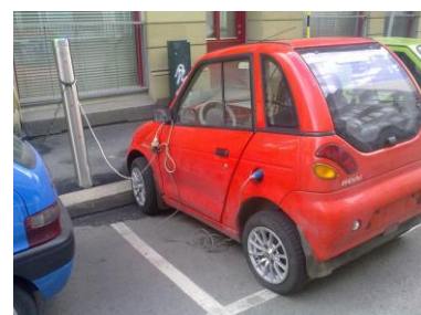
Fig 11 – Skjøteledning på ladekabel