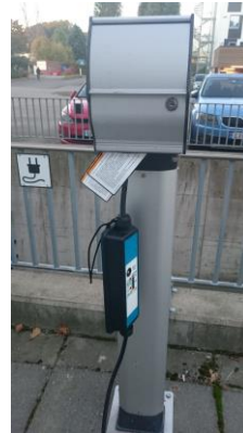
Fig 4 - Mode 2 ladepunkt – oppheng mangler