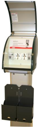
Fig 2 - Mode 2 ladepunkt Schuko med kurv for ladeboks på ladekabel

overoppheting ved langvarig belastning over 10A. DSB er godt kjent med dette fra 170.000 årlige tilsyn i boliger.