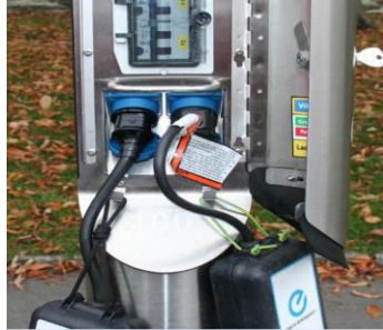
Fig 3 - Mode 2 ladepunkt Schuko med kroker for oppheng av ladeboks