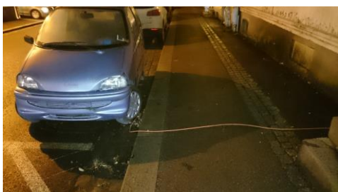
Fig 10 – Kabel over fortau - langs vegg - inn vindu

Det samme gjelder tilkobling av ladeledning på et annet sted enn der elbilen er parkert. DSB erfarer at noen elbileiere legger ladekabel fra bolig og ut gjennom vindu. Da er ladekabel normalt ikke tilkoblet jord og en eventuell elektrisk feil kan medføre livsfare. Kabel er også utsatt for fare for klemskade.