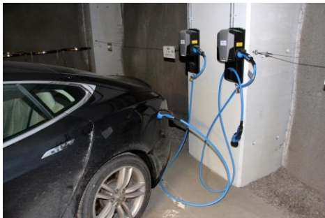
Fig 6 - Mode 3 på vegg lader med Type 2 kontakt